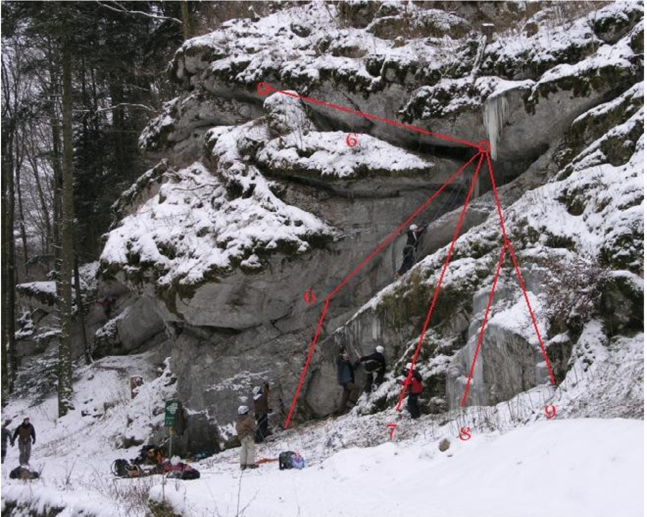
6. - 6' :Hinternanstosserquergang M3 (zweisseillängen Übungsroute für Anfänger, schräg und witzig, vom zweiten Standplatz 15m Abseilen) 7 – 9: Diverse Toprope Varianten M2-M4