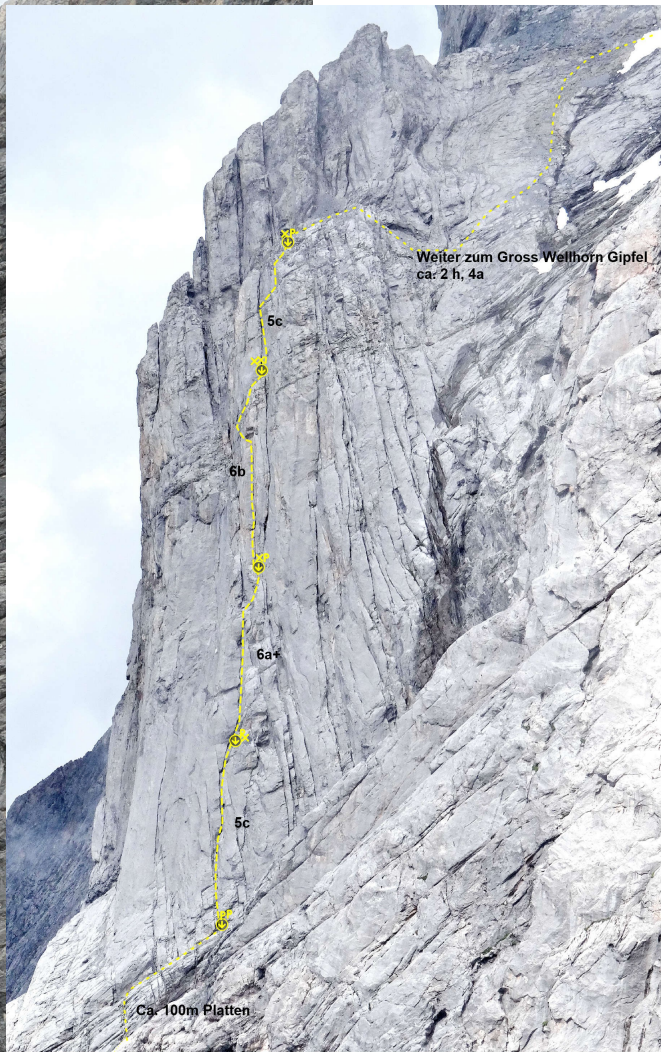
„Paradis des extrémistes“ Zwischen den 2 Teilen der Route liegen etwa 100m Platten (einfach aber heikel)